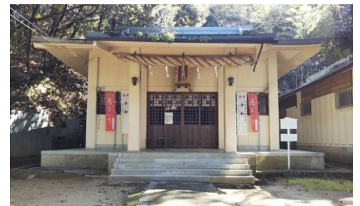
還熊八幡神社本殿